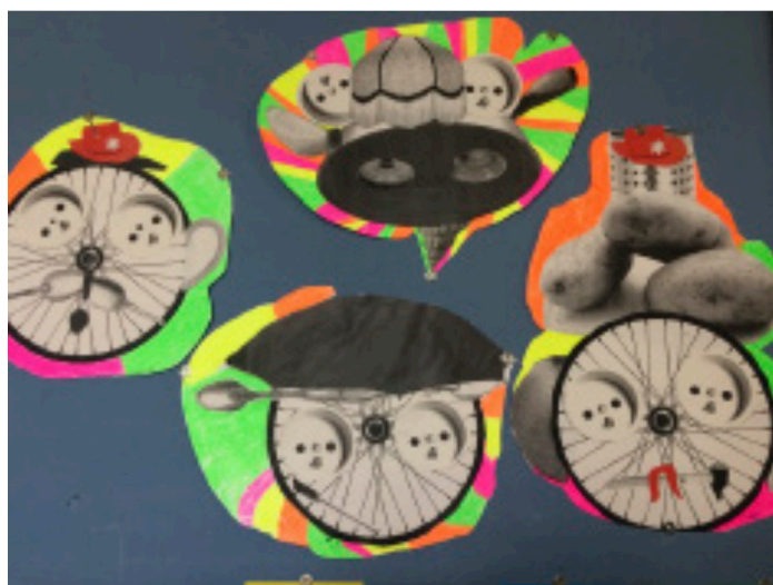
Figure 1 : activité des visages à partir du collage

Dehors il y a des visages avec des compositions exposés, (...) ils avaient des formes photocopiées de différentes grandeurs et ils avaient des consignes, les consignes étaient orales : voilà vous prenez 5 objets et vous devez former un visage. Les objectifs étaient la création, ce n'est pas à la manière de non plus, en tout cas je ne leur ai pas montré autre chose que l'on pourrait faire à la manière de, puis c'était la créativité. Après je me suis rendu compte que certaines photocopies induisaient quelque chose, je n'aurais pas dû en mettre autant, il y avait une photocopie d'une roue de vélo, donc ils l'ont tous utilisé pratiquement pour faire le visage. Enfin ce sont des choses qu'on se rend compte un peu après, en faisant.